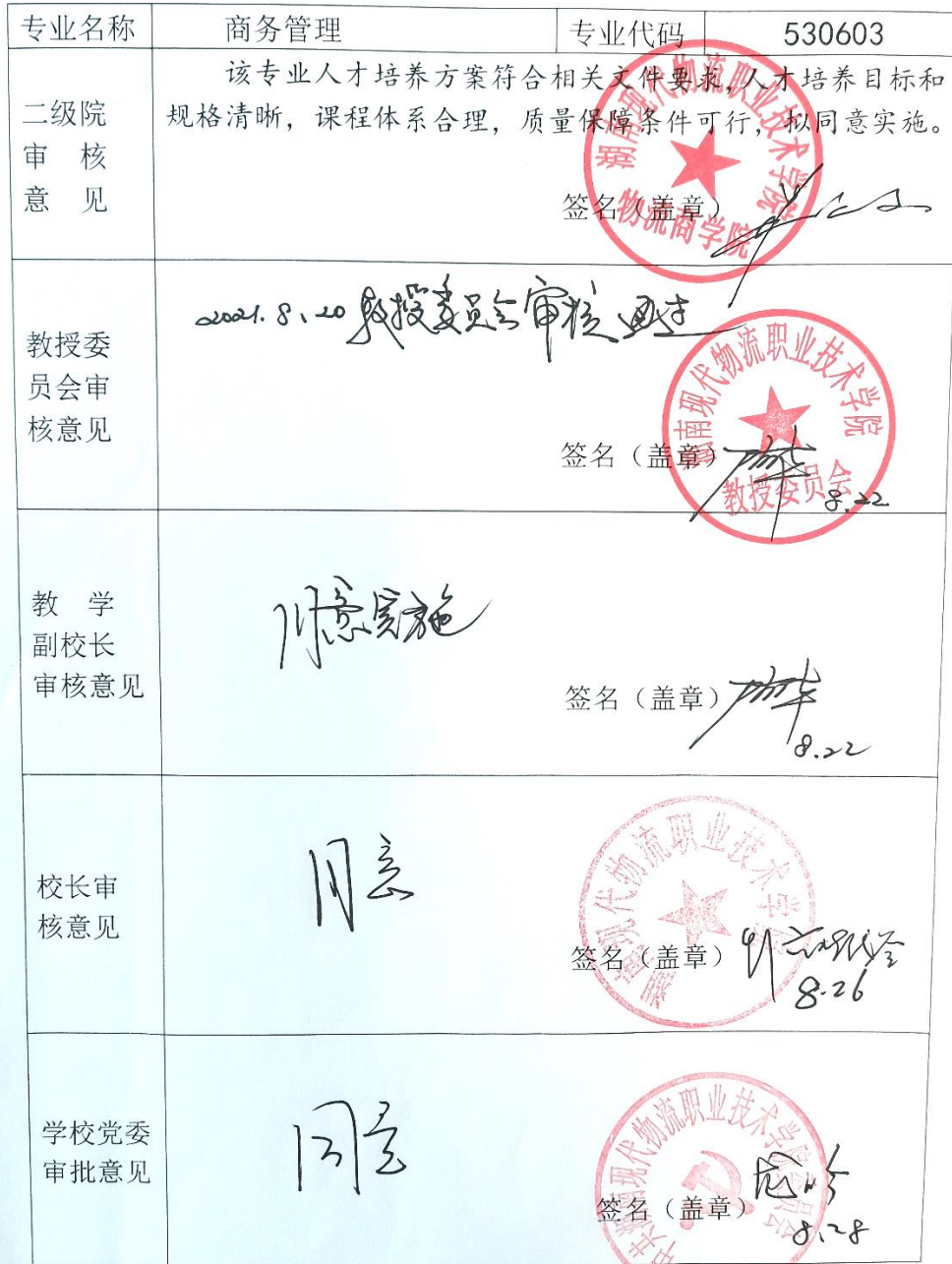
附表 7 专业人才培养方案审批表