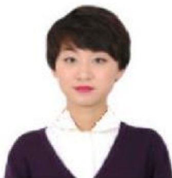
图 1-1-2 女士短发打理标准

请按职业化形象标准，模仿下图所示，现场打理短发。如果考生的发型不符合本题要求，可向考官申请更换同类任务的考题。