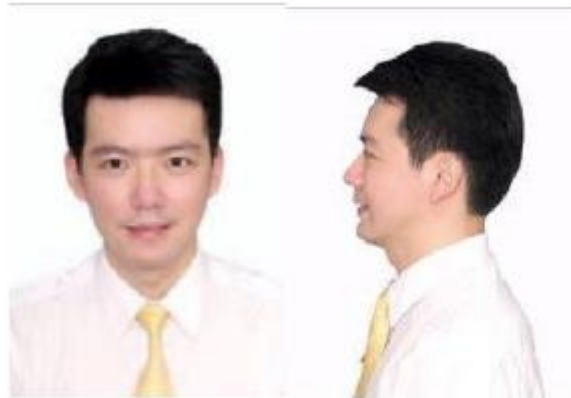
图 1-1-3 男士发型标准