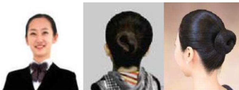
图 1-1-1 女士盘发标准

请按职业化形象标准，模仿下图所示，现场进行端庄式盘发。如果考生的发型不符合本题要求，可向考官申请更换同类任务的考题。