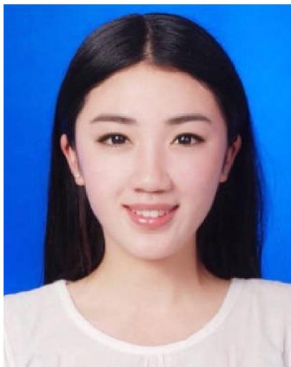
图 1-1-4 女士妆容塑造标准