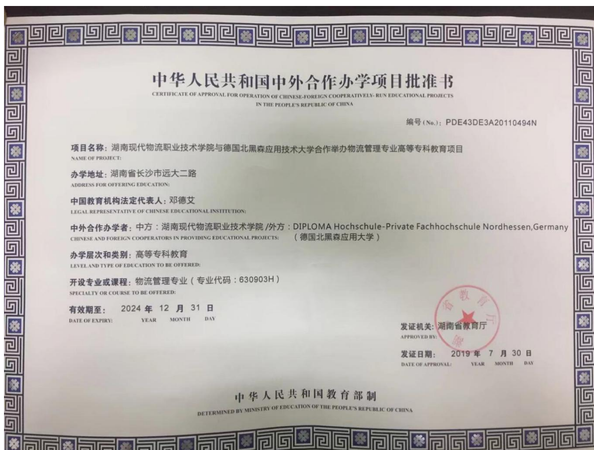
图1 物流管理专业（中外合作办学）项目批准书