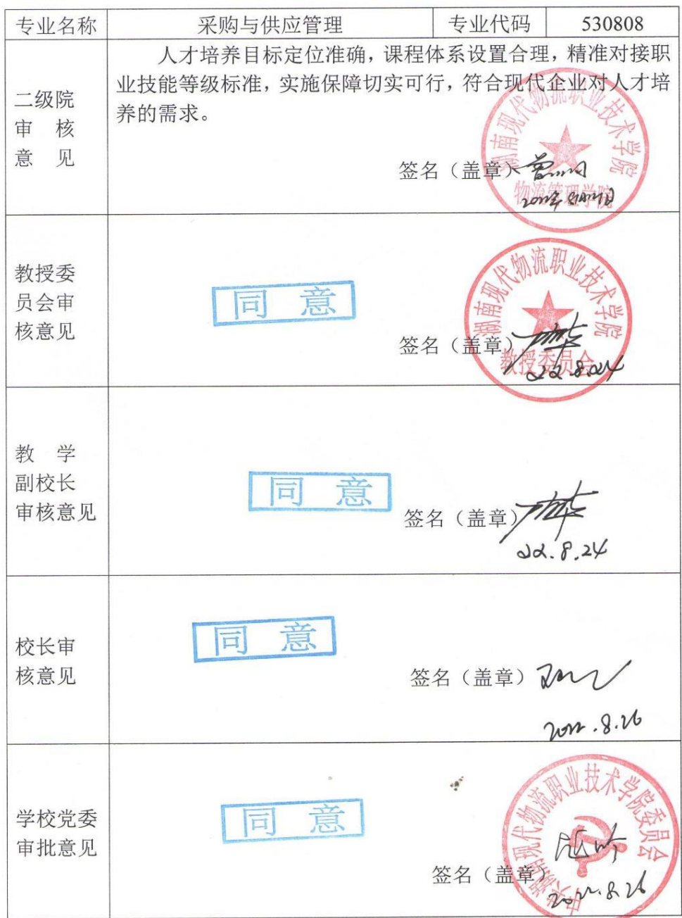
附表 7 专业人才培养方案审批表