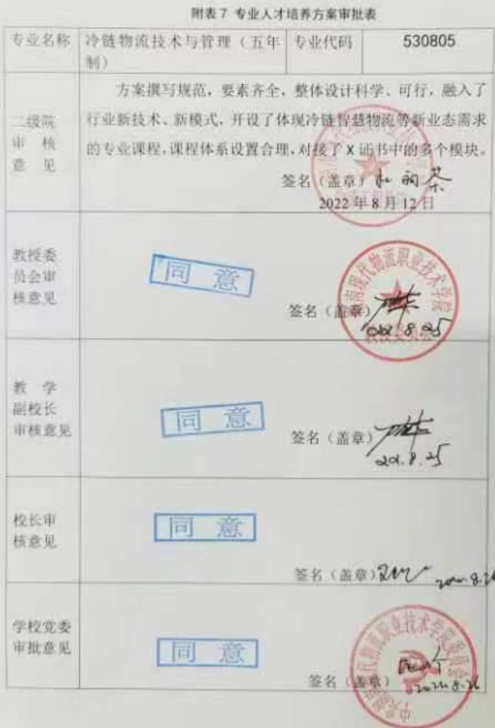
附表7 专业人才培养方案审批表