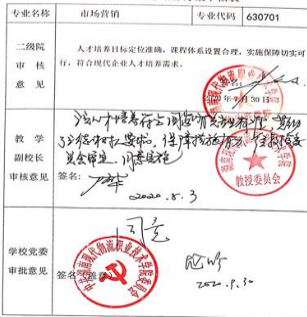
2020级专业人才培养方案审核表