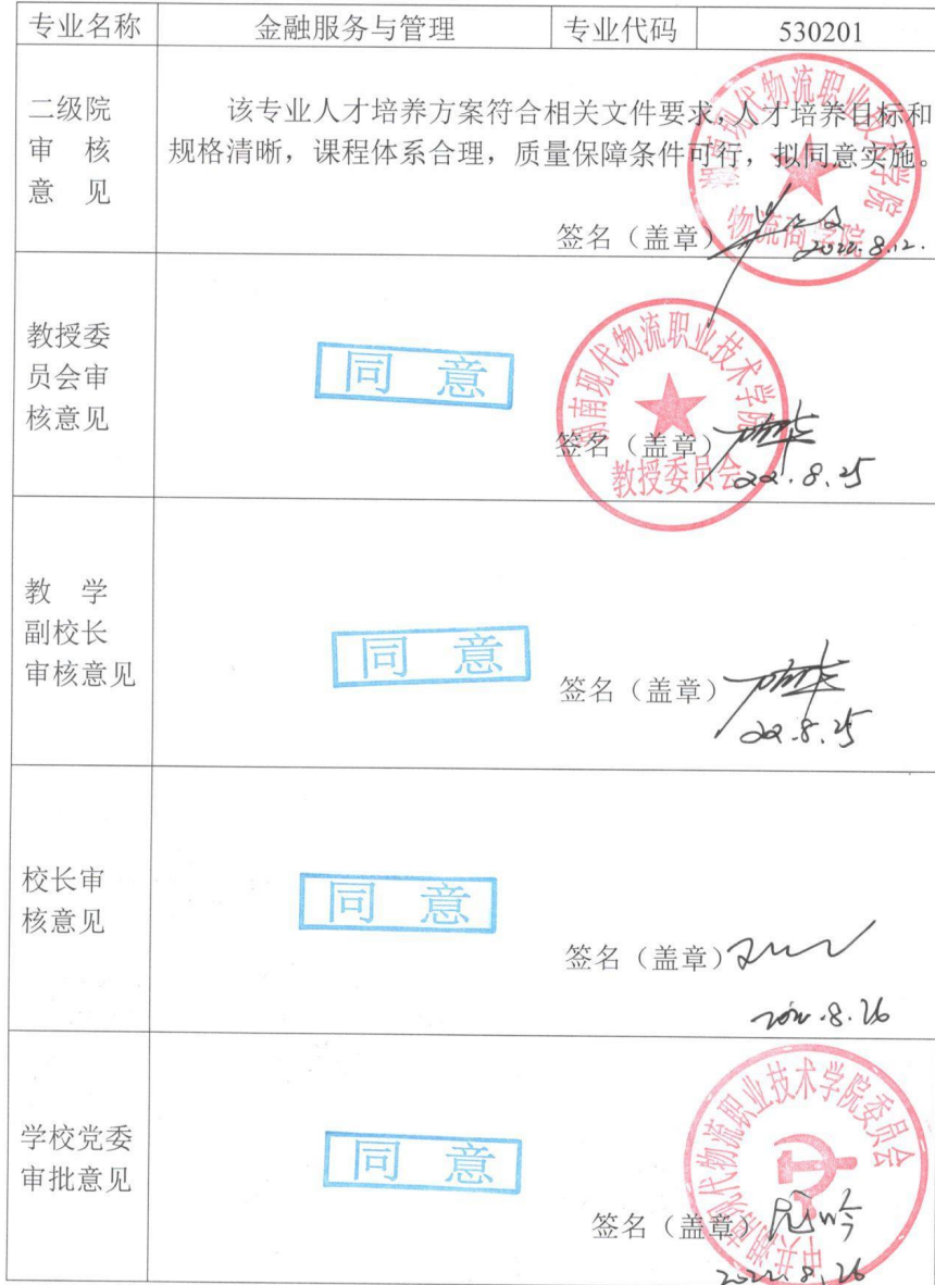
附表 7 专业人才培养方案审批表